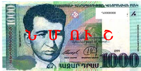
«ՆՄՈՒՇ» մակագրությամբ թթադրամ