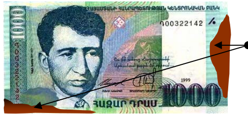
Ներկուտվել կամ գունաթափվել են, սակայն տեսանելի են պատկերները և պաշտպանական հատկանիշները, որոնք թույլ են տալիս որոշել թղթադրամի իսկությունը

Վճարունակ են համարվում, սակայն կարող են փոխանակվել միայն բանկերում այն մետաղադրամները, որոնք`