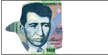
Թթադրամի 60%-ից ավելին չի պահպանվել