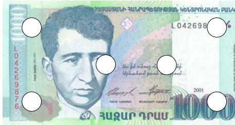
Վեց անցքով դակած թթադրամ