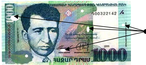
Ունեն աննշան ծակոտիներ, մաշվածություն, բծեր և գրառումներ