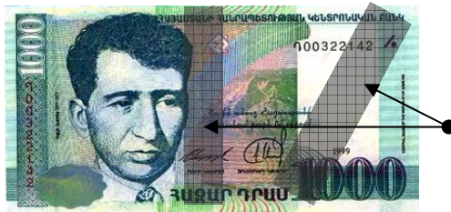
Պատռված և կպցված են նույն թղթադրամի ոչ ավելի, քան 3 մասերը